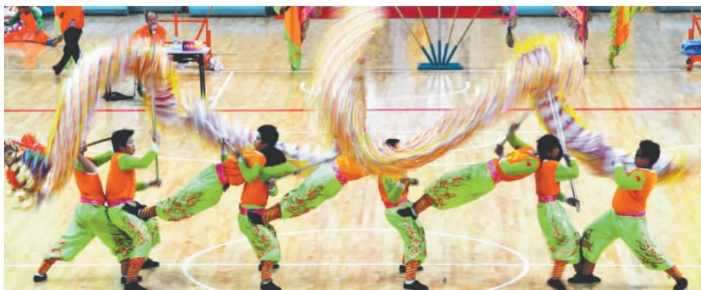
沙溪镇“齐修身 迎新年”民间艺术表演赛在沙溪镇体育馆举行。来自全市33支代表队参加了为期两天的“国标龙”、“高桩醒狮”和“传统南狮”比赛，战况激烈。