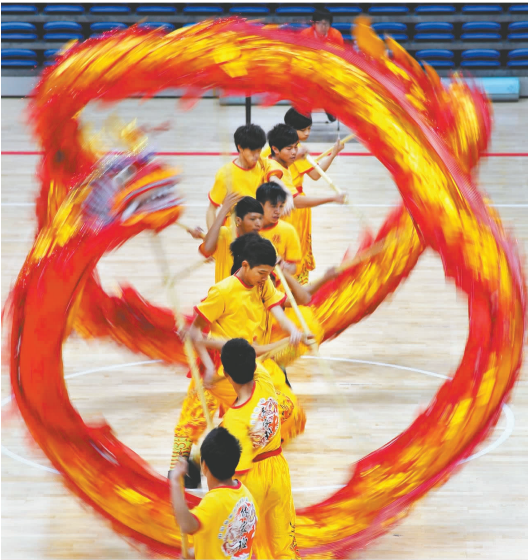
沙溪镇“齐修身 迎新年”民间艺术表演赛在沙溪镇体育馆举行。来自全市33支代表队参加了为期两天的“国标龙”、“高桩醒狮”和“传统南狮”比赛，战况激烈。