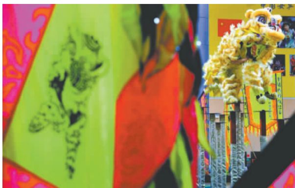
第一天下午高桩醒狮的比赛中。