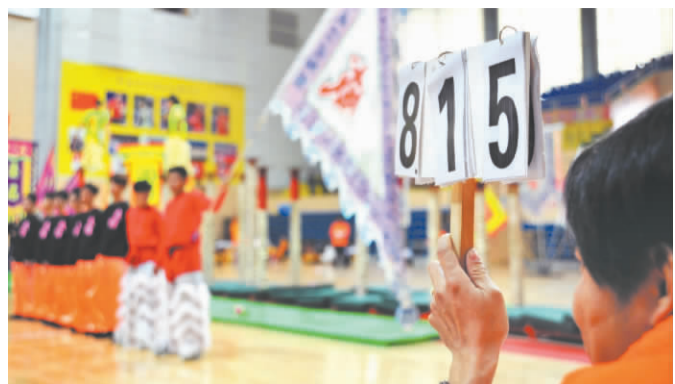
裁判员举起手中的打分牌。