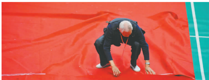
一名老裁判细心地将地毯整理好。

从民间艺术文化吮吸养分，提升全民的文化素养，让更多的人积极主动投入到民间艺术文化的建设中，为传承和弘扬民间艺术出一份力。